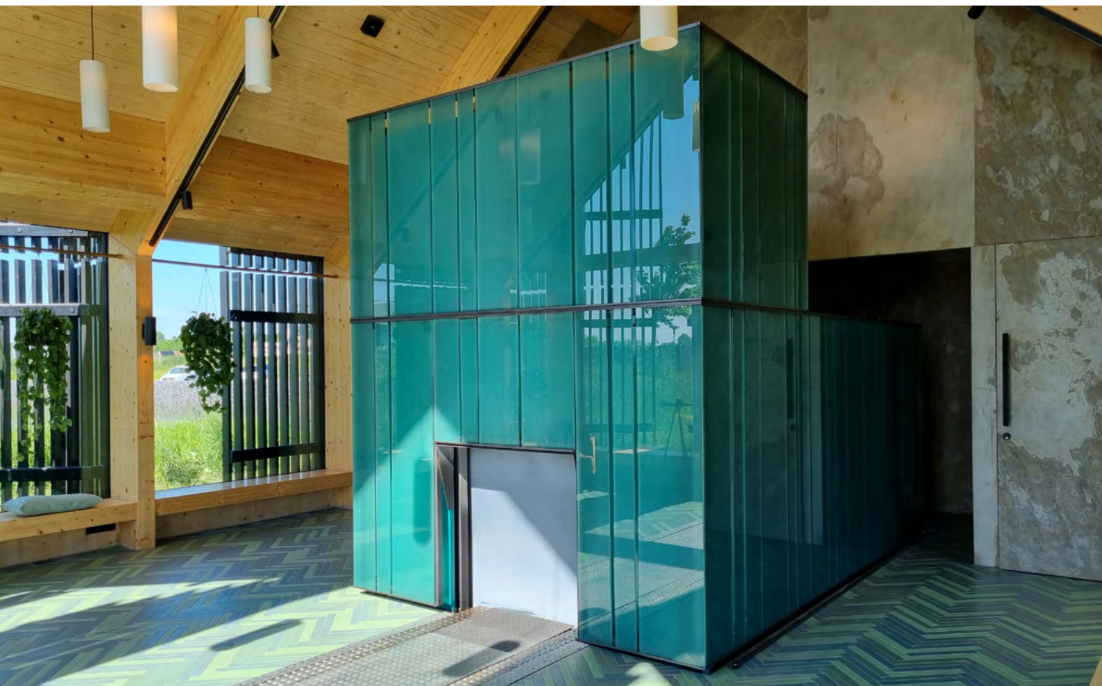
Elektro-Kremationsofen mit Abschiedsraum im niederländischen Krematorium 't Lief

2019 haben die Niederlande vorgelegt – 2021 zog Deutschland nach