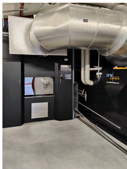
Rückseite des Elektro-Kremationsofens

In der Branche wird die Elektrokremation mit Interesse, aber auch mit Zurückhaltung betrachtet. Hohe Investitionskosten, begrenzte Erfahrungswerte und offene Fragen zur langfristigen Wirtschaftlichkeit bremsen bislang eine breitere Umsetzung. Gleichzeitig wächst das Bewusstsein dafür, dass ökologische Verantwortung zunehmend auch von Auftraggebern und Angehörigen eingefordert wird.